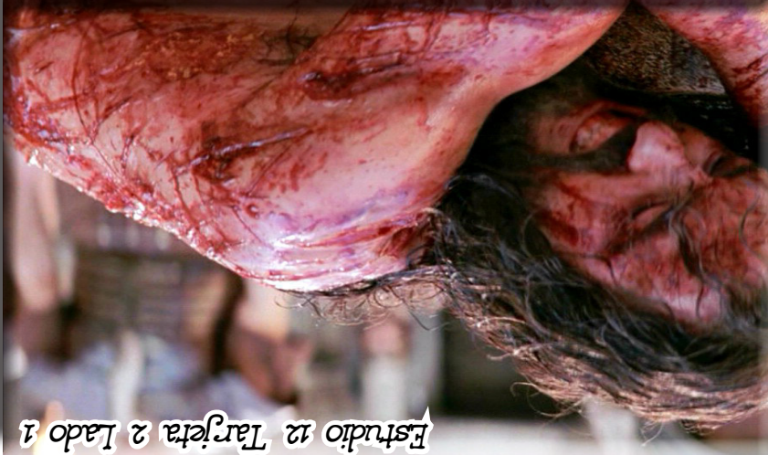
Estudio 12 Tarjeta 2 Lado 1