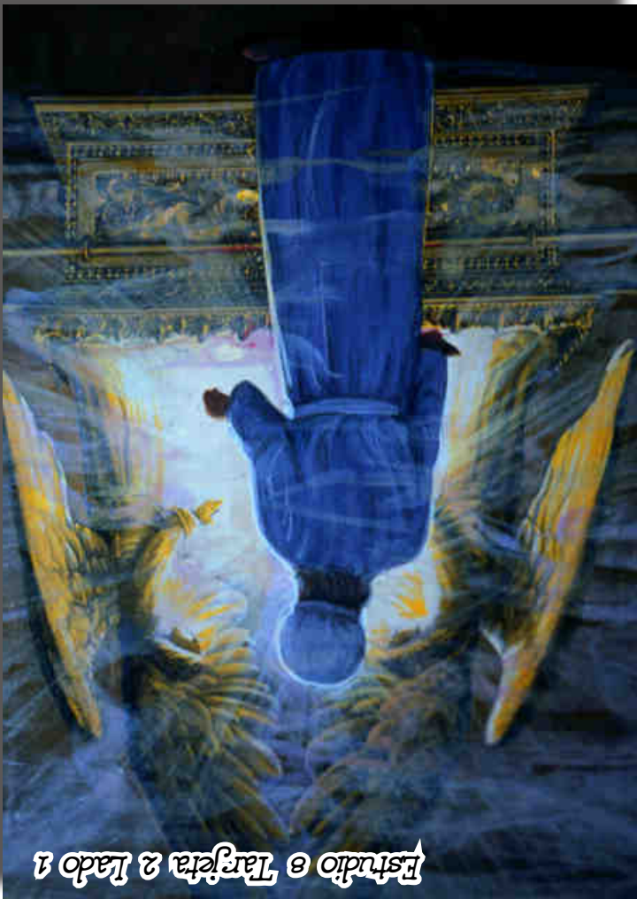
Estudio 8 Tarjeta 2 Lado 1